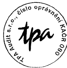
TPA Audit s.r.o. Antala Staška 2027/79, Praha 4 číslo oprávnění 080 KAČR